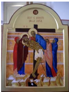
La forza della policromia.

PRIMA DI CONCLUDERE CON IL DECIMO ELEMENTO DELLA STRUTTURA SINTATTICA DELL’ICONA, SI PROPONE BREVEMENTE UN’ESEMPLIFICAZIONE, FRUTTO DI UN’ESPERIENZA DI STUDIO E REALIZZAZIONE.