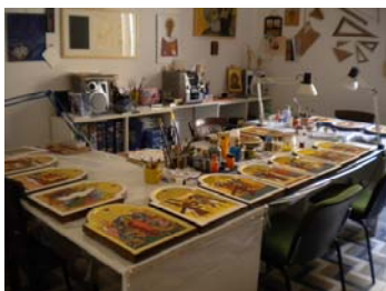
Il calore del colore. La ripetizione del ritmo, l’equilibrio nell’insieme del lavoro.